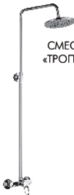
СМЕСИТЕЛЬ ДЛЯ ДУША «ТРОПИЧЕСКИЙ ДОЖДЬ»

В комплекте к смесителю прилагается паспорт изделия и гарантийный талон.