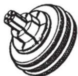
Таблица 3 – Расширительная насадка для трубок из нерж. стали