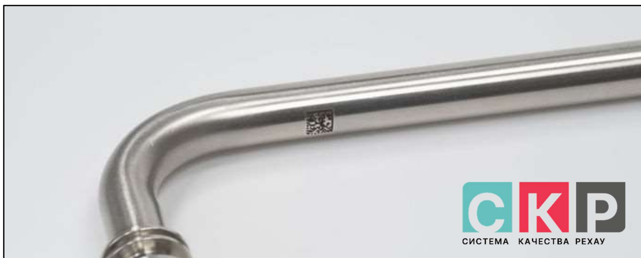
Рисунок 1 – DM код

1.3 Трубка Г-образная имеет маркировку с указанием: