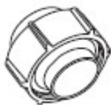
Таблица 4 – Резьбозажимное соединение для трубок из нерж. стали