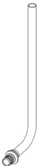
Таблица 2 – Трубка Г-образная PEXAY

3.1 Артикулы изделий указаны в Таблице 2. Артикулы аксессуаров указаны в Таблицах 3-5: