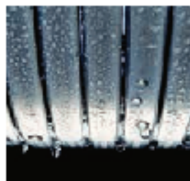
Теплообменник Inox-Radial – эффективный и долговечный

Vitodens 100-W Vitodens 111-W от 4,7 до 35,0 кВт