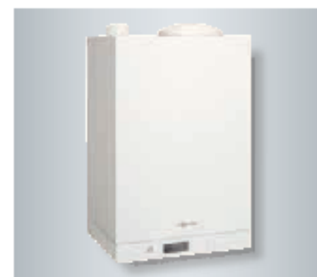
Котел Vitodens 111-W со встроенным 48-литровым емкостным накопителем