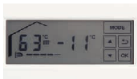
Жидкокристаллический сенсорный дисплей с подсветкой

Настенные газовые конденсационные котлы Vitodens 100-W и Vitodens 111-W управляются при помощи новой жидкокристаллической сенсорной панели управления с подсветкой. Даже в темном помещении легко считывать информацию с дисплея и комфортно пользоваться панелью управления.