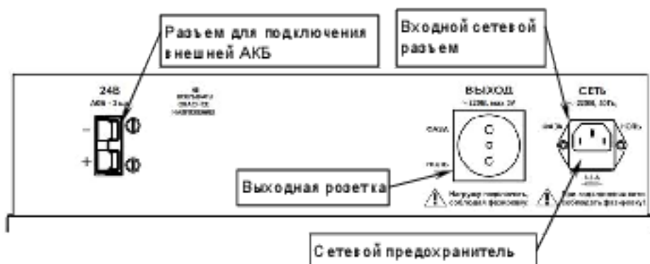
Рисунок 2 – общий вид задней панели источника

Подключение источника к сетевому напряжению осуществляется через входной сетевой разъем и шнур сетевого питания, входящий в комплект поставки.