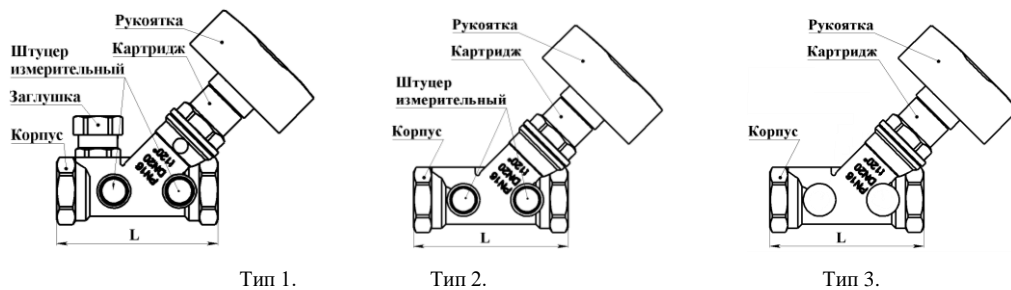
Тип 1. Тип 2. Тип 3. Рисунок 1. Клапан балансировочный ручной STAD.BY.

2.3 Детали клапанов изготовлены из латуни, рукоятка из полимеров, пружина из стали, прокладки из резины или эластомера.