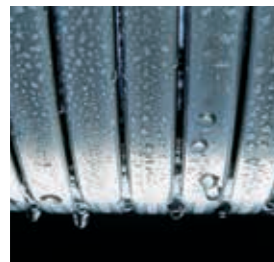
Теплообменник Inox-Radial – эффективный и долговечный