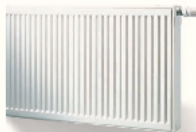
Logatrend VK-Profil с интегрированным термостат-вентилем и нижним подключением