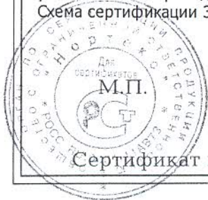
Схема сертификации З.

Маркировка продукции знаком соответствия производится по ГОСТ Р 50460-92. Место нанесения знака соответствия на упаковке и в сопроводительной документации.