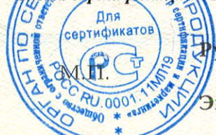
Схема сертификации № 3

ДОПОЛНИТЕЛЬНАЯ ИНФОРМАЦИЯ Маркировка продукции знаком соответствия производится по ГОСТ Р 50460-92. Место нанесения знака соответствия - на изделии и (или) на упаковке и в сопроводительной документации