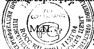
Схема сертификации 3.

Продукция маркируется Знаком соответствия по ГОСТ Р 50460-92 на заводской табличке, в руководстве по эксплуатации, на упаковке.