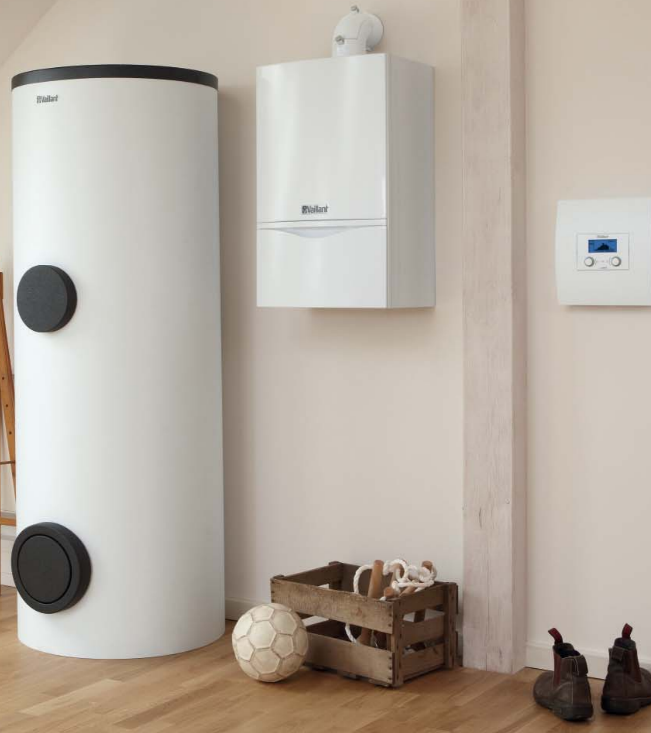
Котёл ecoTEC plus, водонагреватель uniSTOR, устройство регулирования calorMATIC 630/2

* Если иного не требуют местные нормы и правила ** Вычисляется по низшей теплоте сгорания топлива