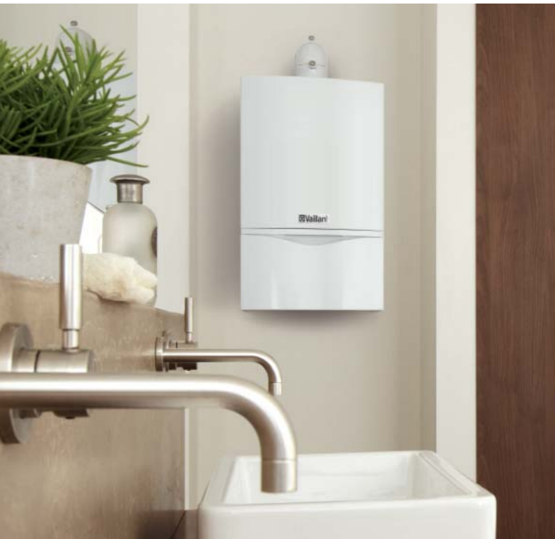
Котёл ecoTEC plus

Конденсационные котлы ecoTEC plus мощностью до 37 кВт.