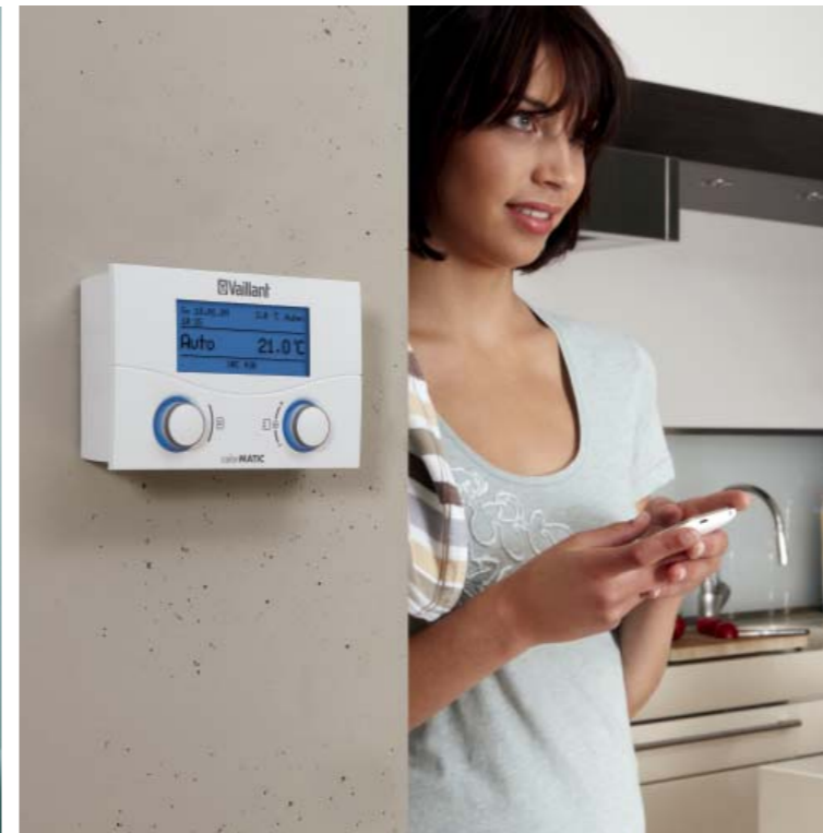
Устройство регулирования calorMATIC 430