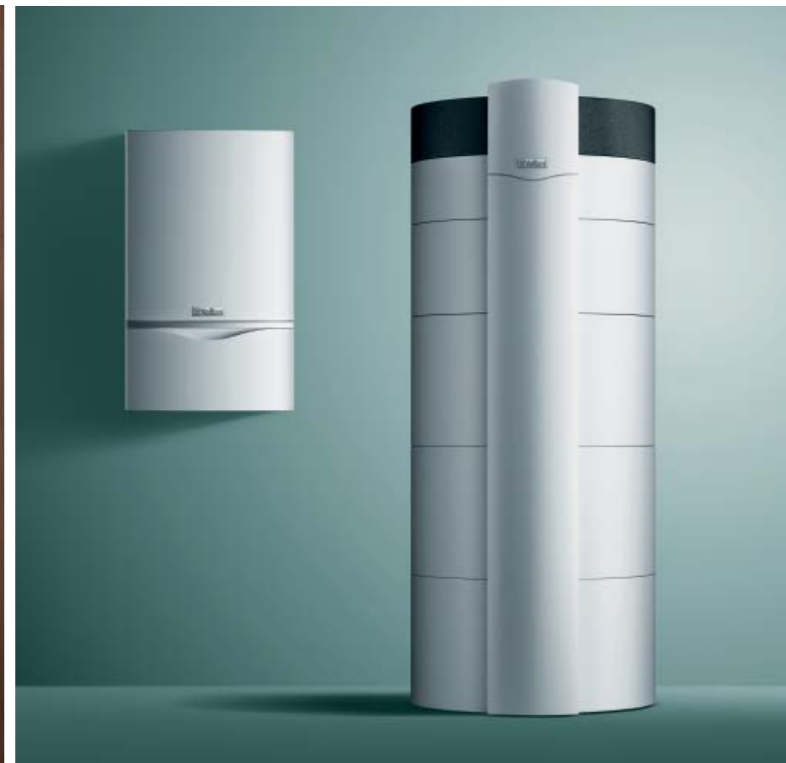
Котёл ecoTEC plus и водонагреватель actoSTOR