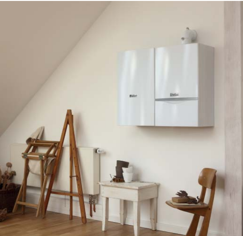
Котёл turboTEC plus и настенный водонагреватель VIH CK 70