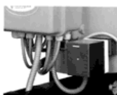
эл. серводвигатель для регулировки воздуха