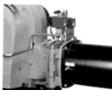
шарнир для инспекции головки сгорания